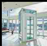
L'ascensore interno per il tuo appartamento

Soluzione ideale per ogni ambiente, il mini ascensore Kone MySpace® , consente di vivere appieno tutti gli spazi di casa senza dover fare le scale. Collegabile a qualsiasi punto luce della casa con un'alimentazione a 230 V, le cabine sono illuminate con faretti a led con una durata fino a 12 volte superiore alle lampade alogene e hanno di serie la luce di emergenza in caso di black out. Quando si verifica un corto circuito inoltre la cabina ritorna automaticamente al piano più basso. Se invece si verifica un arresto per un guasto di altro tipo, un combinatore telefonico permette di comunicare con un massimo di 5 numeri predefiniti dal cliente. L'utilizzo della cortina di luce, una serie di raggi infrarossi che attraversano l'apertura della porta, impedisce la chiusura della porta di cabina in presenza di ostacoli, evitando urti accidentali. Il mini ascensore occupa poco più di un metro quadrato e, se non si dispone dello spazio necessario in muratura, è possibile realizzare una struttura esterna o interna all'edificio, in alluminio o acciaio a seconda del luogo di installazione e del livello di finitura che si desidera. Facilmente adattabili a qualsiasi contesto abitativo, queste strutture possono essere in vetro, se si desidera una forma più leggera, o in metallo, se si vuole una protezione totale dalla luce. www.konemyspace.it