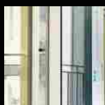
Miniascensori, dentro casa oltre che in condominio